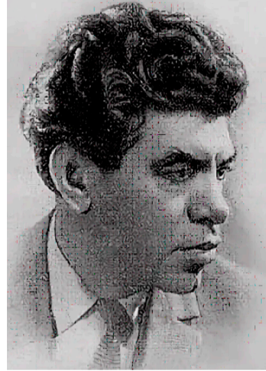
Иллюстрация Алины ГАМГИЯ

Наверное, он догадался о моих раздумьях, но не подал виду и долго молчал. Мне в это время казалось, что из его глаз идут слезы, что он плачет, видит дочку во сне, жалеет слепой глаз бабушки и больше не будет предлагать безумному выпить вина. В этот день я впервые пожалел отца.