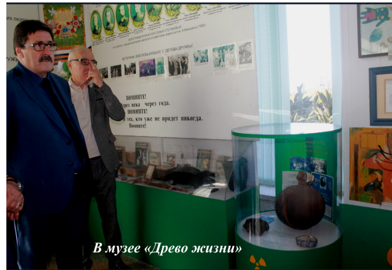
В музее «Дерево жизни»