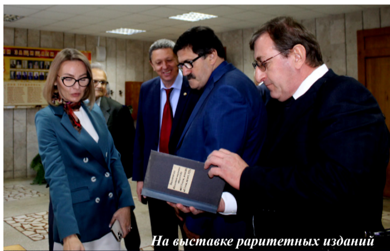
На выставке раритетных изданий

Представители 173 стран причастны к формированию этого удивительного дерева: потрясающим образом переплетаются ветви с плодами мандаринов, лимонов, апельсинов, кумквата (кункана). Рядом с деревом расположена памятная стела, на которой все страны должным об-