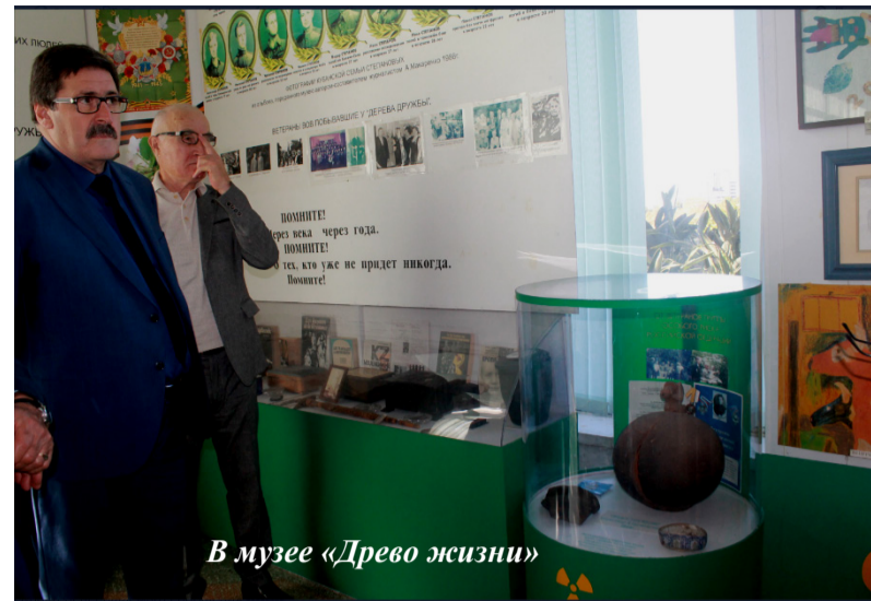
В музее «Дерево жизни»