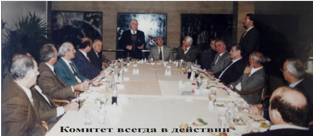
Комитет всегда в действии

пресса освещала все военные события, всю ситуацию в собственной интерпретации, пропитанной ложью.