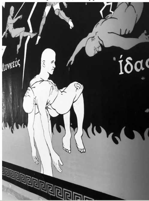
Фрагмент свитка «Смерть» триптиха «Маска Диоскуров»

дидись храмы, а много позже были названы звезды в созвездии Близнецов. Люди моего поколения, как и поколения моих родителей, – продолжил художник, – фактически не знакомы с античной историей, если не получили специального образования и не интересовались греческой мифологией. Другая причина создания триптиха кроется в желании привнести один, возможно, очевидный фрагмент из античной истории Сухума. То есть привнести намёк на возможность существования в Диоскуриде некоего артефакта, о котором не сохранилось свидетельств в немногочисленных древних письменных источниках, раскрывающих быт и нравы Диоскуриады, но который мог иметь место в религиозной составляющей поселенцев, почитающих братьев, т.к. наличие храма или, как минимум, алтаря, посвящённого Диоскурам, – не вымысел, ибо если строится город, названный в честь богов, то в этом городе строится и одноимённый храм. А если есть храм, то в храме может храниться артефакт, имеющий отношение к божеству, и таким сакральным артефактом в храме Диоскуров могла быть