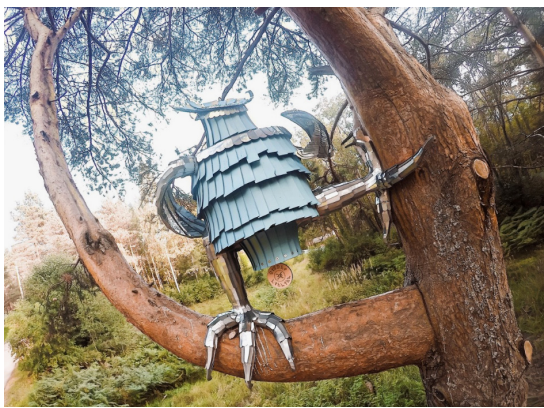
Скульптура на дереве – «Хархарх»

рых не затрагивается аргонавтика. И предмет истории не затрагивает мифологию Диоскуриды. В результате дети об этом знают мало или ничего, считает ГенЭрген. Также он считает, что культурно-религиозные аспекты античной истории Абхазии раскрыты недостаточно. Учёные в основном только датируют факты и события, и их мало интересуют культура народов и их устремления и чаяния, то, о чем они думали и чем жили.