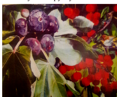
Серенада солнечной долины

Материал предоставил художник Сасун ТОРОСЯН, подготовил к публикации Артавазд САРЕЦЯН