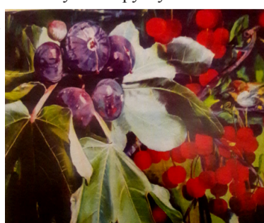
Серенада солнечной долины

Материал предоставил художник Сасун ТОРОСЯН, подготовил к публикации Артавазд САРЕЦЯН