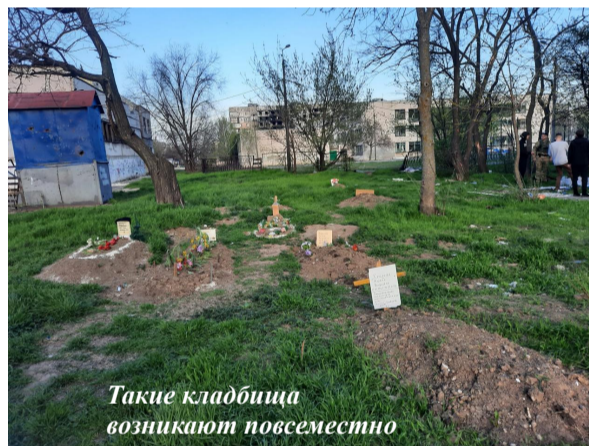
Такие кладбища возникают повсеместно