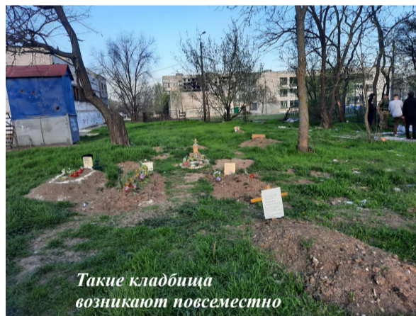
Такие кладбища возникают повсеместно