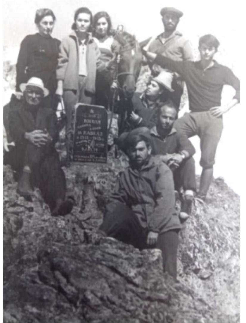
На вершине Басса