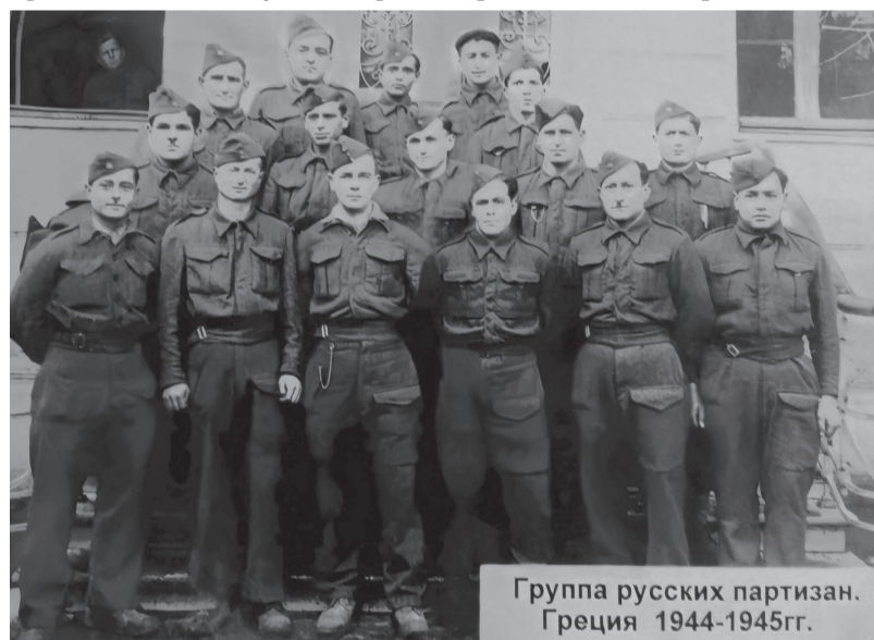
Группа русских партизан. Греция 1944-1945гг.