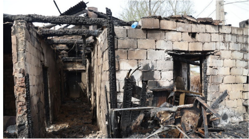
ВСУ обстреляли населенный пункт Новоайдар в ЛНР из комплекса «Точка-У». Погибла женщина.

Союза. Что, они забыли Суворова, как их уничтожали и европейцы, и турки? А сегодня они выступают за уничтожение Рос-