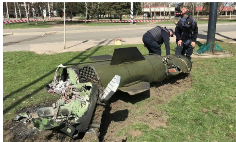
ВСУ нанесли удар с использованием ТРК «Точка-У» по железнодорожному вокзалу Краматорска (ДНР). Погибли не менее 50 человек, в т.ч. пятеро детей, более 100 человек получили ранения.

союз. НАТО начало подступать к границам России, и волевой политик Владимир Владимирович Путин понял, что это будет иметь непредсказуемое продолжение, а Украина собирается войти в состав НАТО. Четыре огромные войсковые группировки должны были войти на Украину и объявить о том, что она – зона их стратегических интересов и, будьте добры, сюда не суйтесь. Таким образом, на теле России образовалась раковая опухоль. Очень серьёзная, которая прогрессирует с каждым днём. И я считаю, что на это нужно было раньше реагировать, так как опухоль имеет свойство обрастать метастазами. Россия готовилась к такому развитию событий, даже к пакету санкций была готова. Кто больше пострадает от