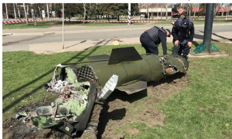
ВСУ нанесли удар с использованием ТРК «Точка-У» по железнодорожному вокзалу Краматорска (ДНР). Погибли не менее 50 человек, в т.ч. пятеро детей, более 100 человек получили ранения.

союз. НАТО начало подступать к границам России, и волевой политик Владимир Владимирович Путин понял, что это будет иметь непредсказуемое продолжение, а Украина собирается войти в состав НАТО. Четыре огромные войсковые группировки должны были войти на Украину и объявить о том, что она – зона их стратегических интересов и, будьте добры, сюда не суйтесь. Таким образом, на теле России образовалась раковая опухоль. Очень серьёзная, которая прогрессирует с каждым днём. И я считаю, что на это нужно было раньше реагировать, так как опухоль имеет свойство обрастать метастазами. Россия готовилась к такому развитию событий, даже к пакету санкций была готова. Кто больше пострадает от