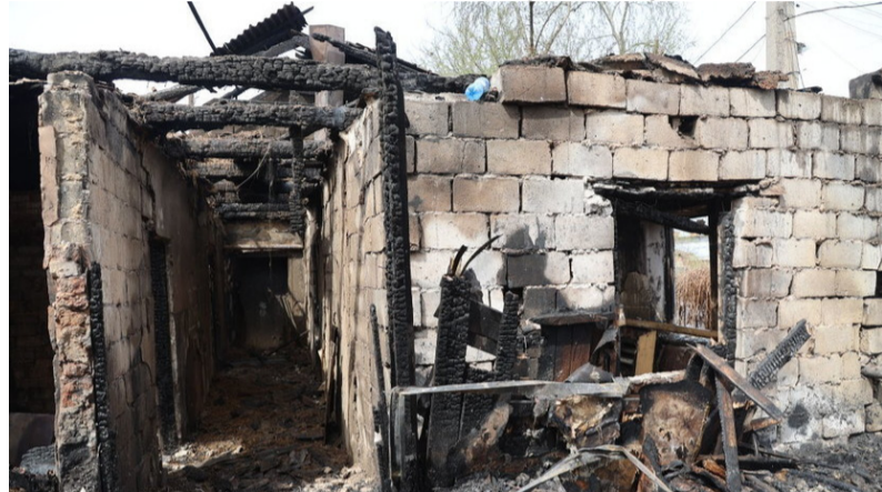
ВСУ обстреляли населенный пункт Новоайдар в ЛНР из комплекса «Точка-У». Погибла женщина.

Союза. Что, они забыли Суворова, как их уничтожали и европейцы, и турки? А сегодня они выступают за уничтожение Рос-