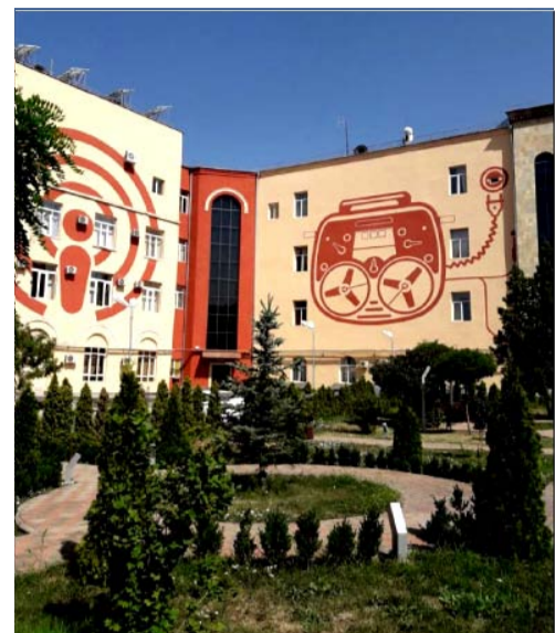
Дом Армянского радио в Ереване