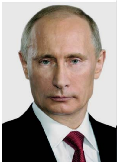
Президент РФ Владимир Путин направил избранному президенту Абхазии Бадре Гунба

поздравительную телеграмму. «Уважаемый Бадра Зурабович, примите искренние поздравления по случаю Вашего избрания президентом Республики Абхазия. Победа на выборах, прошедших в условиях свободного народного волеизъявления, подтвердила поддержку абхазскими гражданами Вашей линии на обеспечение внутривнутриполитической стабильности и поступательного социально-экономического развития страны.