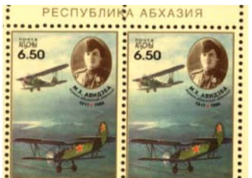
Первая абхазская военная летчица Мери Хафизовна Авдзба (1917 – 1986).