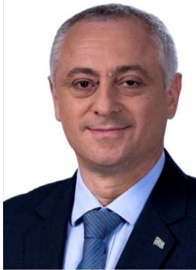
1 марта Бадра Гунба набрал 54,73 % голосов. За него проголосовало 54 954 человека.

Рассчитываю, что дружественные, союзнические российско-абхазские отношения будут и далее укрепляться на благо наших братских народов», – отмечается в телеграмме. Владимир Путин пожелал Бадре Гунба успехов, крепкого здоровья и благополучия.