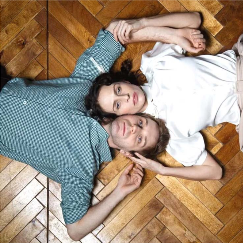
На фото сцена из спектакля «Таня»