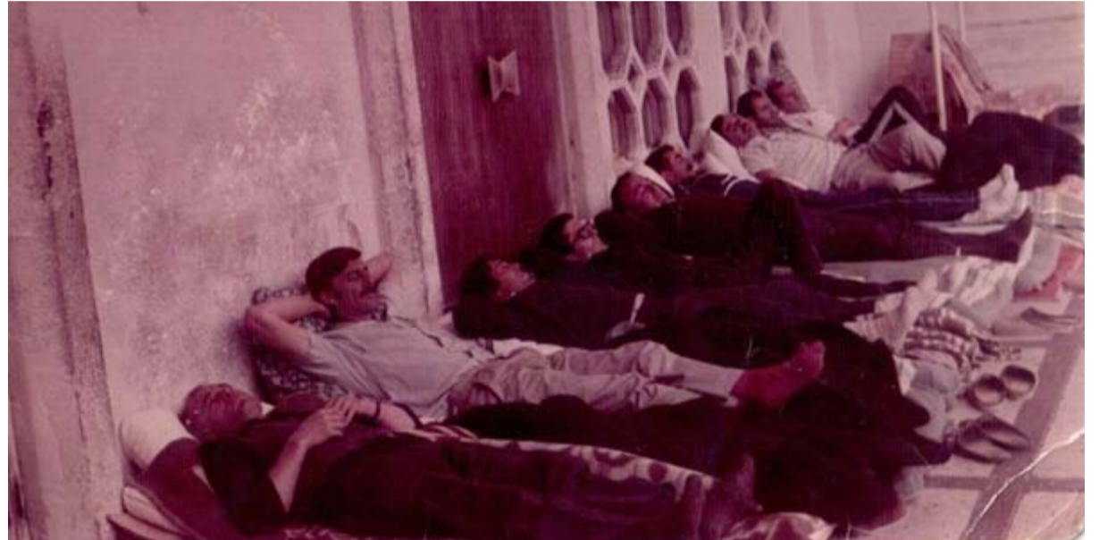
У входа во Дворец культуры, где объявили сухую голодовку гагрцы-гаграа. Сентябрь 1989 года.

В городе Гудауте 18 сентября 1989 года состоялось расширенное собрание актива района совместно с руководителями Абхазии, с представителями Народного форума Абхазии «Айдгылара» и Республиканского забастовочного комитета. Была послана телеграмма в Москву на имя Генерального Прокурора СССР А.Я. Сухарева с просьбой о взятии в своё производство всех уголовно-следственных дел по июльским событиям в Абхазии