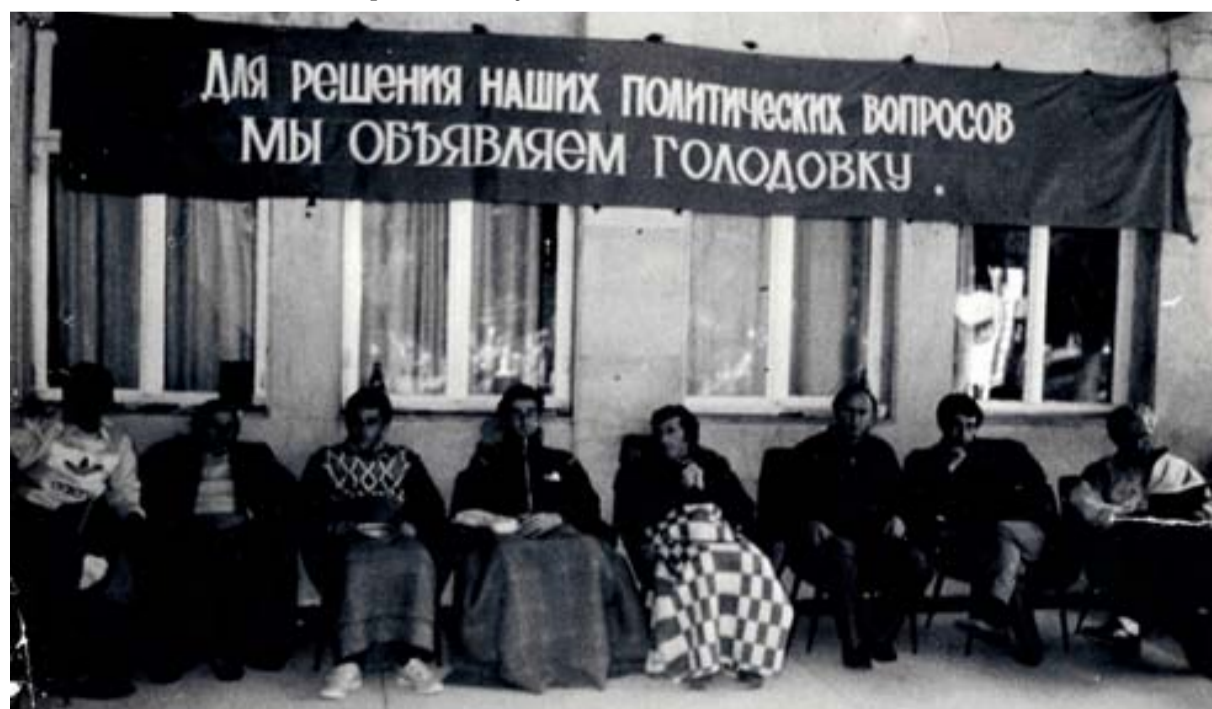
У входа во Дворец культуры, где объявили сухую голодовку пицундцы-амзараа. Сентябрь 1989 года.