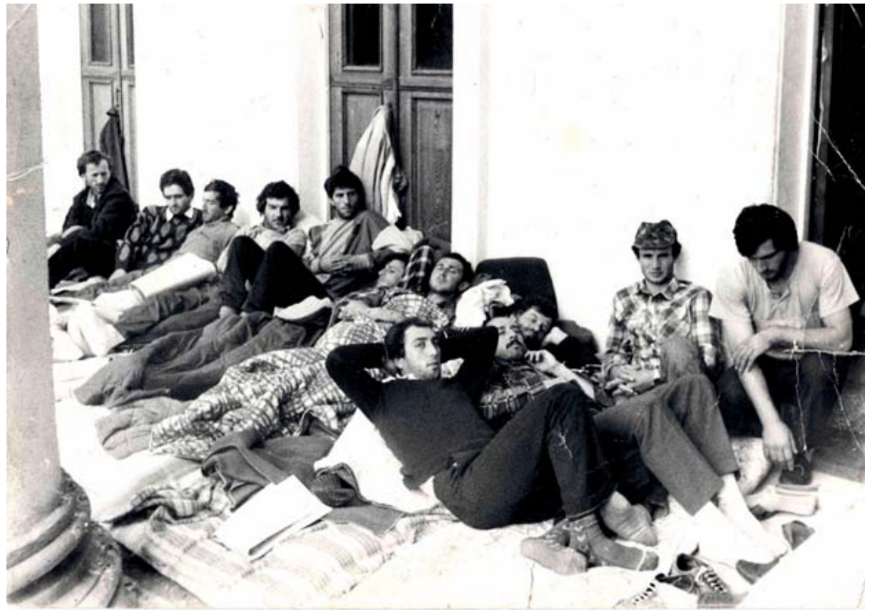
Гудаутцы, объявившие «сухую голодовку». У входа во Дворец культуры. Сентябрь 1989 года.

В ответ на вседозволенность грузинского нацизма в Абхазии, 5 сентября 1989 года в республике начались политические акции абхазов: бойкот, невыход на работу, неподчинение, неповиновение властям, приостановка работы госучреждений, организаций,