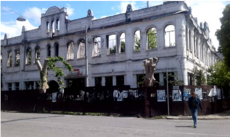
Сгоревшее здание управления телеграфного агентства в Сухуме

о памятнике Индо-Европейскому телеграфному пути, захотелось самой побывать в Гагре, посмотреть и сфотографировать столб. Он стоит на центральной улице между зданиями городской Администрации и почты. На столбе указаны направления телеграфа в виде стрелок из металла с названиями многих основных городов, связывавшихся линией, а внизу у столба телеграфный аппарат Морзе, через который передавались первые телеграммы,