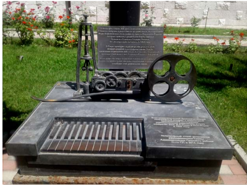
Телеграфный аппарат Морзе

Всего в Сухумском парке более 80 электрических столбов формы сименских телеграфных, куда входят и 12 отреставрированных. Все столбы обошлись почти в 600 тысяч рублей. В эту сумму вошли и расходы на плафоны – так называемые пушкинские. Из старых индо-европейских плафонов сохранился (но сохранился же!) только один, чугунный. Он более узкий, менее габаритный и со стеклами.