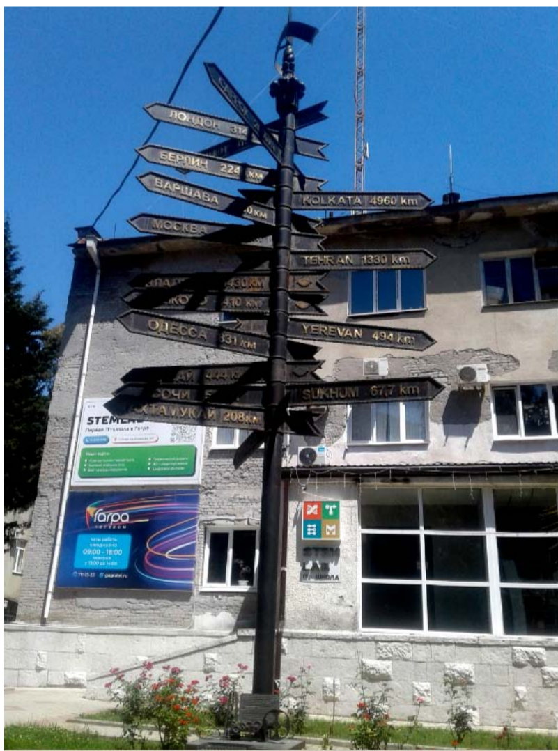
Гагра. Памятник-столб в честь телеграфной линии

тогда и рассказали, куда и откуда вел этот кабель, кому нужна была связь с далекой Индией, впрочем, являвшейся долгое время колонией Англии. Правда, я тогда решила, что кабель был закопан в земле, а столбы являлись опознавательными знаками. Сейчас же, готовя эту публикацию, поняла, что линии были воздушными.