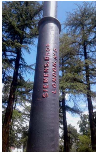
Нижняя секция телеграфного столба с эмблемой «Сименс и К°» в сухумском парке