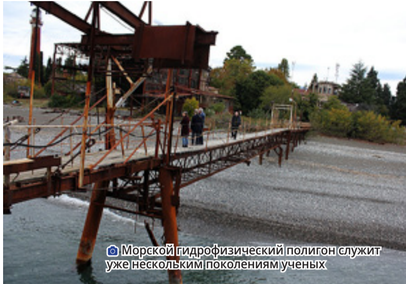
Морской гидрофизический полигон служит уже нескольким поколениям ученых

– Впервые о возможностях совместной работы в лаборатории «Морской гидрофизический полигон» зашла речь во время меро-