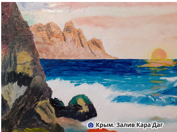
Крым. Залив Кара Даг