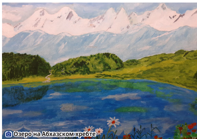
Озеро на Абхазском хребте

– В хозяйствах думают уже о следующем сезоне. Пока мы не знаем, каким он будет, но все, что зависит от человека, от нашей ответственности, внимания к земле, мы непременно выполним.