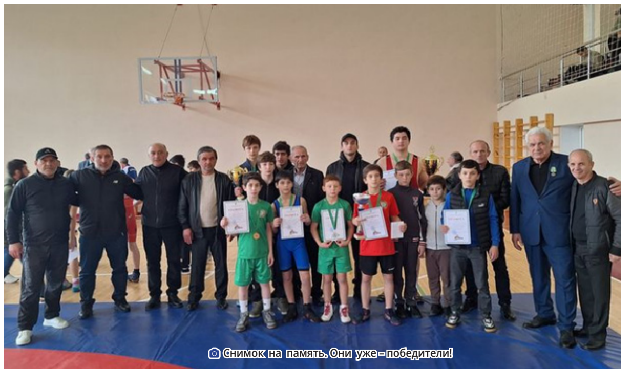
© Снимок на память. Они уже – победители!

Воспитанники ДЮСШ г. Гудауты имени Михаила Чачба завоевали десять медалей разного достоинства. В копилке гудаутских спортсменов: 2 золотые медали, 4 серебряные, 4 бронзовые. Для начинающих спортсменов эти первые победы имеют большое значение, о которых они будут помнить. Именно из первых побед вырастают настоящие чемпионы! Вообще, каждый турнир – это своеобразная ступень к будущим серьезным испытаниям. Прошедший турнир имени Раца Хутаба дал нам возможность стать свидетелями красивой спортивной борьбы.