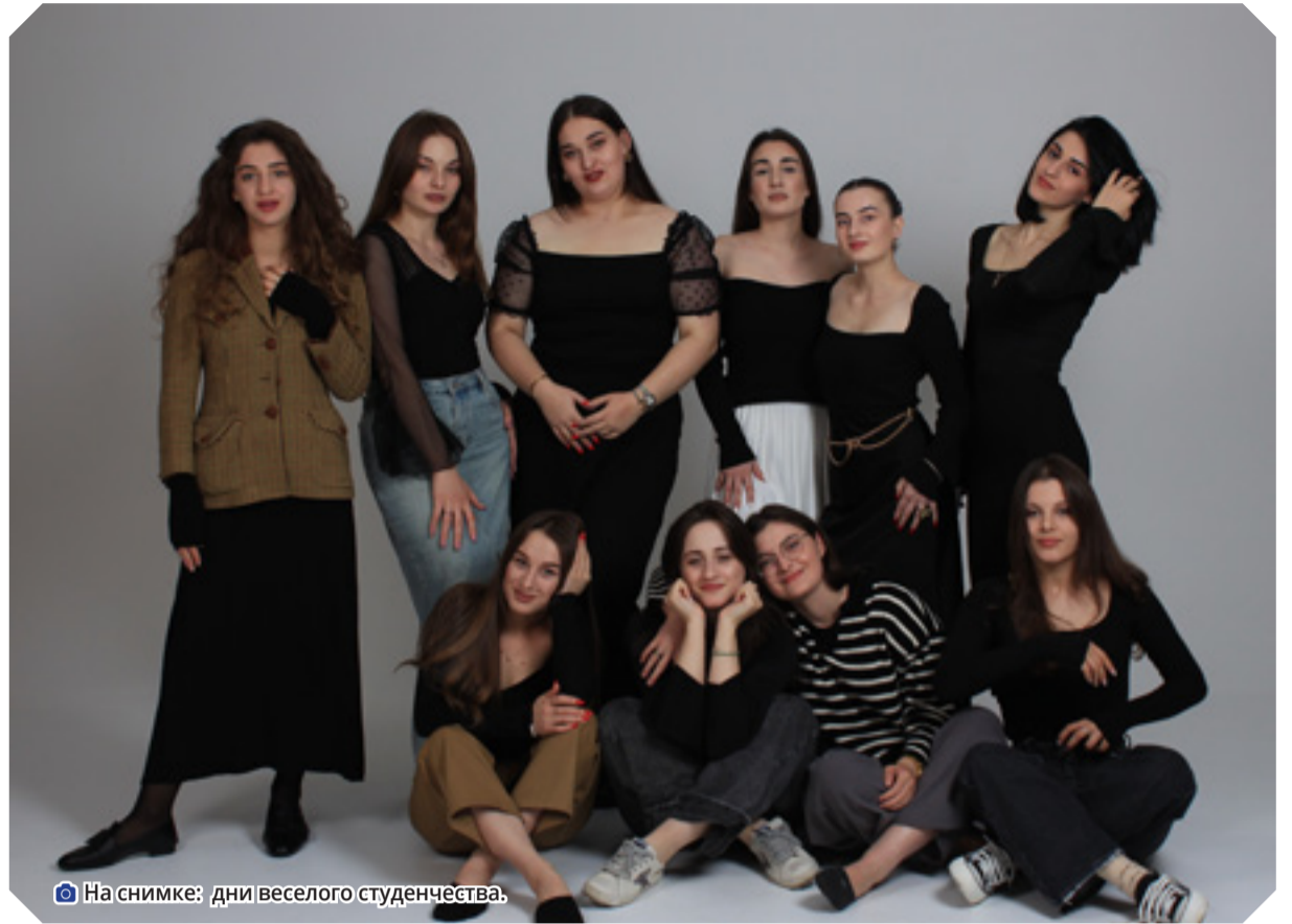
На снимке: дни веселого студенчества.