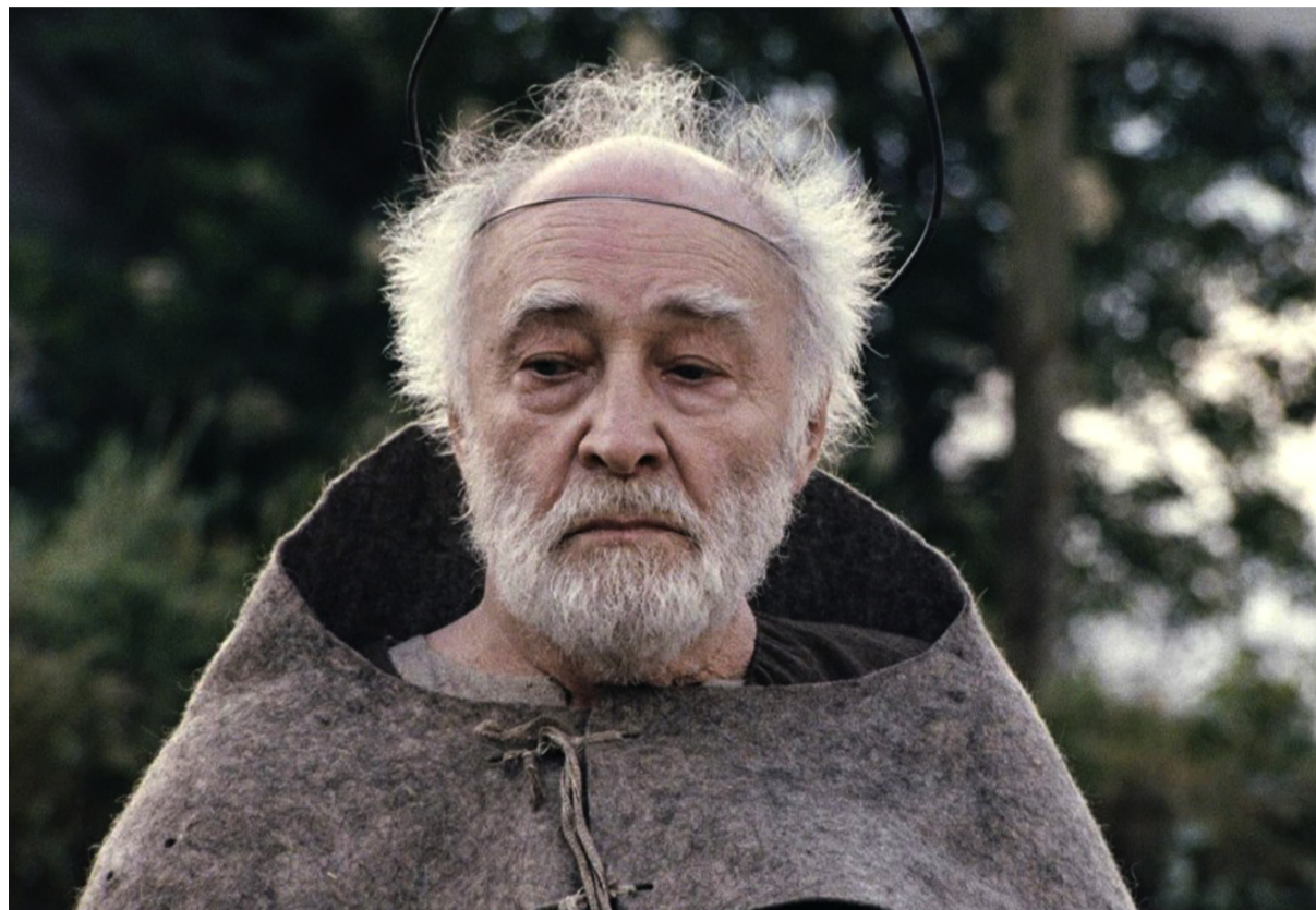
Кадр из фильма «Андерсен. Жизнь без любви». Последняя роль Вячеслава Тихонова – Всевышний.

развеселить» обстановку, я стала вручать ему абхазские дары, рассказывая при этом, с какой любовью и уважением в нашей республике говорят о нем и полнотью разделяют вердикт многих исследователей киноискусства: Вячеслав Тихонов – артист неповторимый и великий! Я не могла отделаться от нахлынувшего сравнения, что Вячеслав Васильевич, как и в знаменитых «Семнадцати мгновениях весны», слушает, воспринимает, анализирует, принимает ответные действия почти без слов, но всем все понятно.