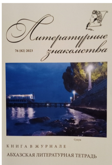
КНИГА В ЖУРНАЛЕ АБХАЗСКАЯ ЛИТЕРАТУРНАЯ ТЕТРАДЬ