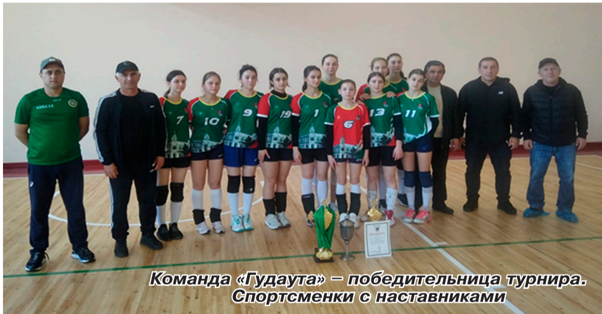
Команда «Гудаута» – победительница турнира. Спортсменки с наставниками