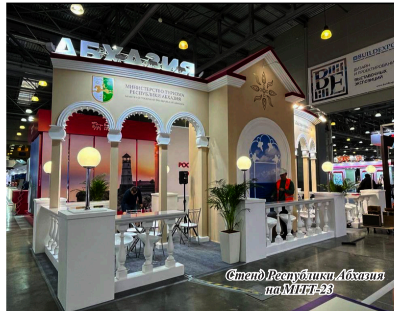
Стенд Республики Абхазия на МИТТ-23

участие Чрезвычайный и Полномочный Посол Республики Абхазия в Российской Федерации Алхас Квициния. Он внимательно ознакомился с тем, чем Абхазия привлекает будущих туристов, пообщался с членами делегации, представляющей нашу республику на этой престижной выставке. В составе делегации – министр туризма Теймураз Хишба, представители различных туркомпаний и туроператоров, профсоюз экскурсоводов и трансфера Абхазии. Теймураз Хишба, рассказывая о значимости и целях участия нашей республики в этом престижном международном форуме деятелей современ-